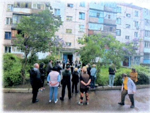
26.05.2021 року установчі збори просп. Юності, 45