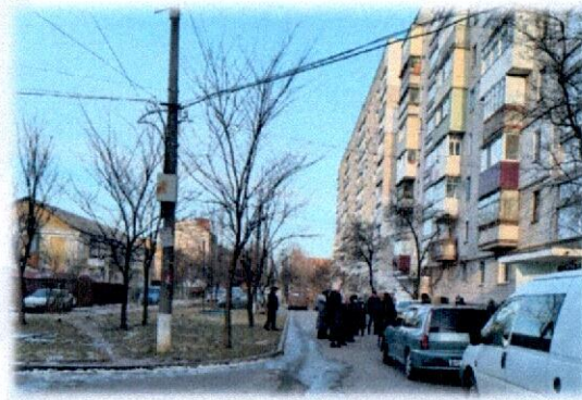
26.12.2021 року загальні збори вул. П.Тичини, 21