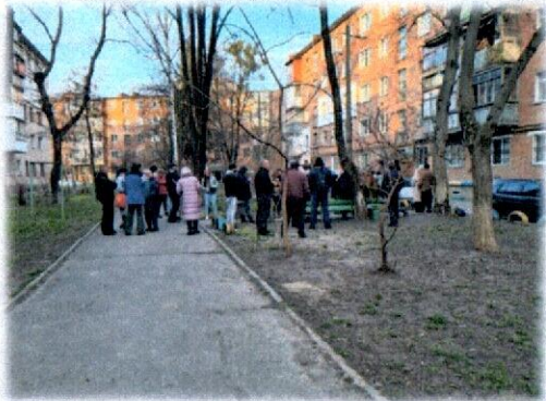
04.04.2021 року установчі збори вул. Київська, 23